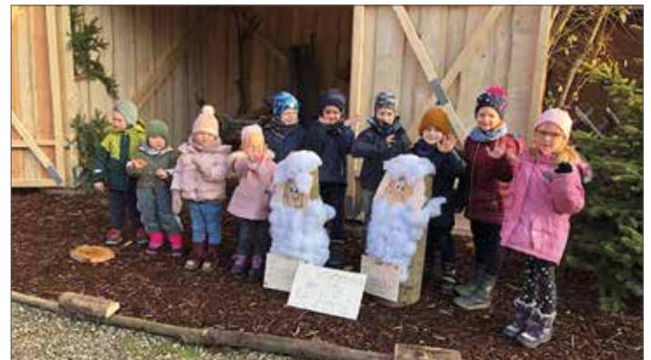
Zwei Schäfchen brachten die Mädchen und Jungen aus der Kita St. Alfrid zur alten Pfarrkirche St. Godehard.