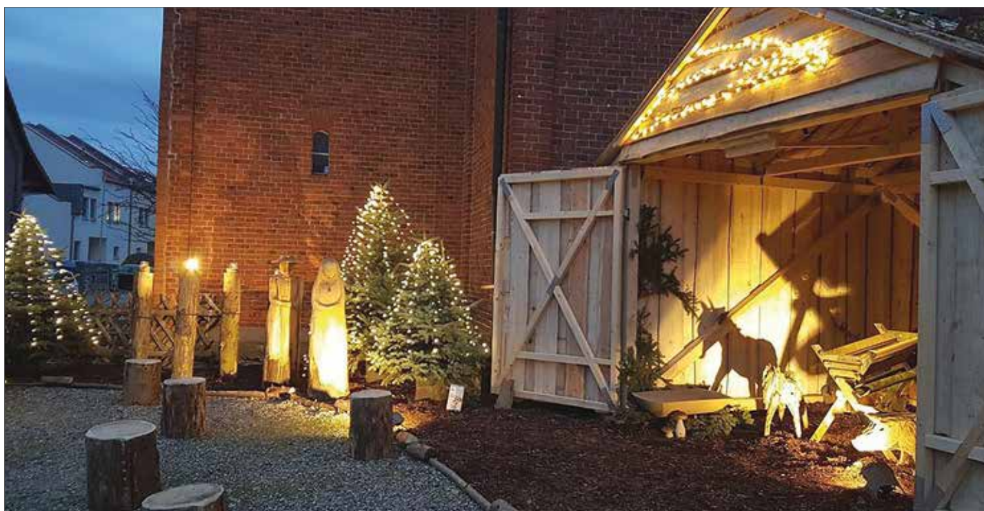
Stimmungsvolle Atmosphäre mit Weihnachtsbäumen, Adventskerzen, Maria und Josef sowie einem liebevoll ausgestatteten Stall.